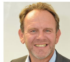
Stefan Grützmaker SGBB GmbH