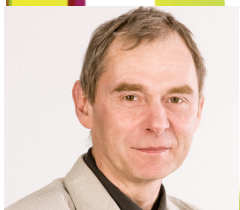
Uwe Fügner Stadtwerke Strausberg GmbH