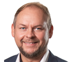
René Claussen Zenner IoT Solutions GmbH