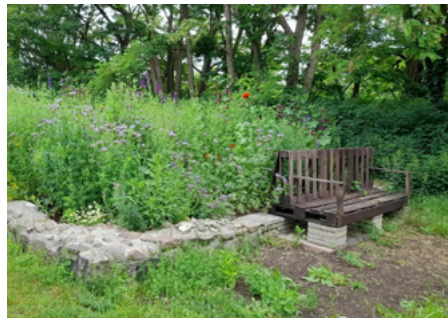
Neues Leben im Nachbarschaftsgarten: gerade wird die neue Blühfläche mit Samen der letztjährigen Bienenwiese angesät – eines von vielen Biotopprojekten

rie Schulze vom Vorstand betont. Die Einrichtungen des JSV bieten für jede Altersgruppe passende Angebote. Für die Kleinsten gibt es individuelle Betreuung in der Kita „Mühlenwichtel“ mit dem Konzept „kleine Kita, große Geborgenheit“. Die Schul- und Kitabegleitung unterstützt Kinder und Jugendliche, insbesondere mit AD(H)S oder ASS, in ihrer Entwicklung und sozialen Teilhabe. Der Aktivspielplatz Strausberg lädt zum Entdecken und Spielen in der Natur ein. In enger Kooperation mit der Grundschule und dem Hort „Am Wäldchen“ wird hier spielerisches Lernen gefördert. Die Offene Kinder- und Jugendarbeit (OKJA) vermittelt Medienkompetenz für Kinder, Jugendliche und Erwachsene und bietet Präventionsprojekte wie das „Schwarze Theater“ oder „Graffiti-Walls“ an.