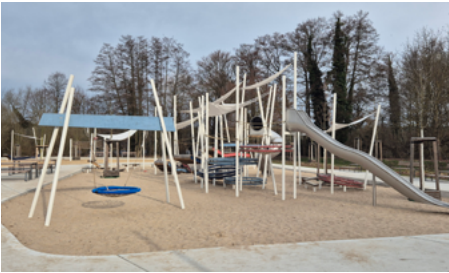
Der neu entstandene Spielplatz ist bereits für die Öffentlichkeit freigegeben.

Die Stadt Strausberg informiert, dass der erste Bauabschnitt im Kulturpark ab sofort für die öffentliche Nutzung freigegeben ist.