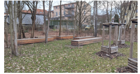
Gartennischen und neue Baumpflanzungen laden zum Verweilen ein.

des Segelsportvereins und der Neubau eines Service- und Funktionsgebäudes für den Vereinssport. Die ansässigen Wassersportvereine – der Drachenboot-Verein „Lakeside Dragons“ und der