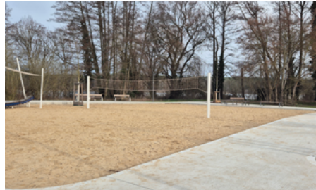
Auch im neuen Kulturpark: Beachvolleyball bleibt fester Bestandteil.

An verschiedenen Stationen im Kulturpark präsentieren die beteiligten Landschaftsarchitekten der Franz Reschke Landschaftsarchitektur GmbH aus Berlin die bereits umgesetzten Maßnahmen sowie die weiteren Planungen. Dazu gehören unter anderem die geplanten Ufersicherungsmaßnahmen im Bereich