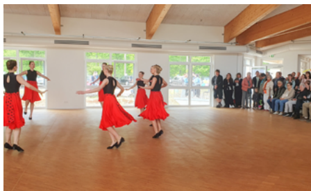
Tanz und Musik beim Tag der offenen Tür im Vorjahr.

legenheit, einen Blick hinter die Kulissen der Klinik zu werfen und mit dem Team vor Ort ins Gespräch zu kommen. Für das leibliche Wohl ist gesorgt. Ebenso