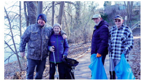
Die Mitglieder vom Anglerverein waren die ersten unterwegs und deckten den Uferwanderweg von der Kopernikusstraße bis zum Fähranleger Waldseite ab.

Abschnitt des Uferwanderwegs vor. Am Wasserturm stattete die Bürgerinitia-