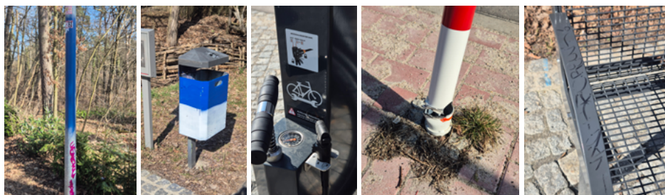
Die Schäden sind divers: Auf der Fahrradstraße „Alte Gleistrasse“ wird wiederholt auch mutwillig öffentliches Eigentum beschädigt.

Trotz der Herausforderungen bleibt die Fahrradstraße ein wichtiger Beitrag zur Förderung des Radverkehrs in Strausberg. Im Jahr 2026 soll zudem die Entwurfsplanung für den zweiten Abschnitt entlang des Handelscentrums bis zum Anschluss an die Ernst-Thälmann-Straße finalisiert werden. So kann im Jahr 2027 voraussichtlich mit den Bauarbeiten für das letzte Ende begonnen werden.