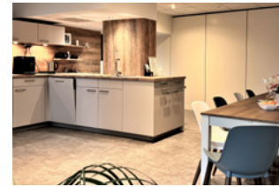
MuT: Attraktive neue Räume am Marienberg.

Der Mobile unterstützende Teilhabedienst (MuT) hat neue Büroräume in Strausberg (Am Marienberg 65) bezogen, um näher an den Menschen im Landkreis Märkisch-Oderland zu sein und seine Angebote auszubauen. Das Team wurde