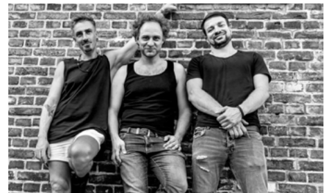
Cover-Band Fakoro sorgt beim Frühlingsfest für gute Stimmung

Auch am Veranstaltungstag des Frühlingsfestes erwartet die Gäste ein umfangreiches Bühnenprogramm. Auf der Bühne am Markt sorgt die Band „Fakoro“ von 12:00 bis 18:00 Uhr mit Cover-Hits aus vergangenen und aktuellen Zeiten für Unterhaltung. Das Repertoire umfasst dabei Hits von ZZ Top bis Wackelkontakt und wird von den fünf Musikern mit hoher Qualität und energiegeladener Live-Performance präsentiert. Ergänzt wird das Programm ab 15:00 Uhr durch