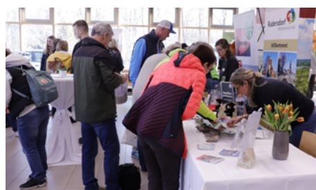
2. Tourismustag : entdecken, informieren, staunen

Das Programm bot Information und Unterhaltung zugleich: Um 11.45 Uhr wurde das Sparkassen-Tourismusbarometer