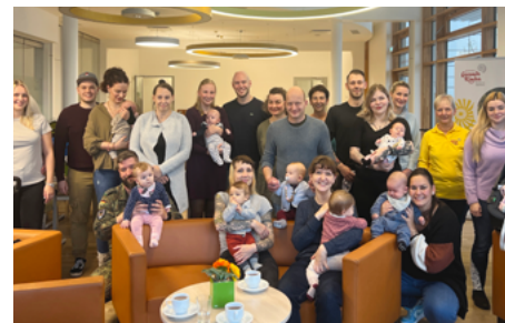
Beim letzten Café informierten sich Eltern im Krankenhaus MOL über familienfreundliche Angebote.

Das Strausberger Bündnis für und mit Familien sowie das Netzwerk Gesunde Kinder Märkisch-Oderland laden frischgebackene Eltern herzlich zum Babybegrüßungscafé ein. Die nächste Veranstaltung findet am 5. Mai um 15:00 Uhr in der Heinrich-Mann-Bibliothek, Hegermühlenstraße 58, statt. Das Angebot ermöglicht Austausch, Vernetzung und Informationen zu familienfreundlichen Angeboten. Eine Anmeldung per E-Mail an karoline.erping@stadt-strausberg.de ist erwünscht.