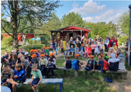
Regel Andrang beim Sommerfest auf dem Aktivspielplatz

Auf der Basis von 33 Jahren Vereinsgeschichte entwickelt sich der Jugendsozialverbund (JSV) Strausberg stetig weiter, um gesellschaftlichen Herausfor-