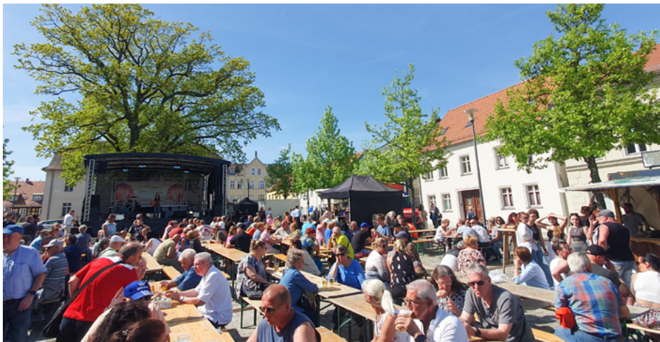
Viele Gäste genossen schon im letzten Jahr die Sonne und das musikalische Programm auf dem Strausberger Frühlingsfest.

Stadeler. Danach sind alle Besucher eingeladen, bei abwechslungsreicher Musik sowie einem vielfältigen Angebot an Speisen und Getränken gemeinsam in den Mai zu tanzen und den Abend in geselliger Atmosphäre zu genießen.