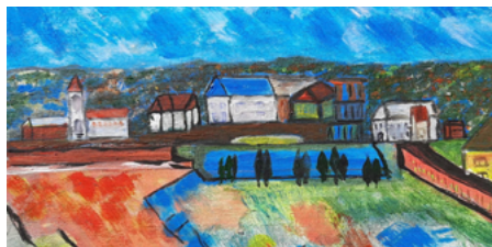
Die Bilder erzählen von den Reiseeindrücken der Künstlerin.

Besuchende können die Ausstellung während der regulären Öffnungszeiten der Stadtverwaltung besichtigen.