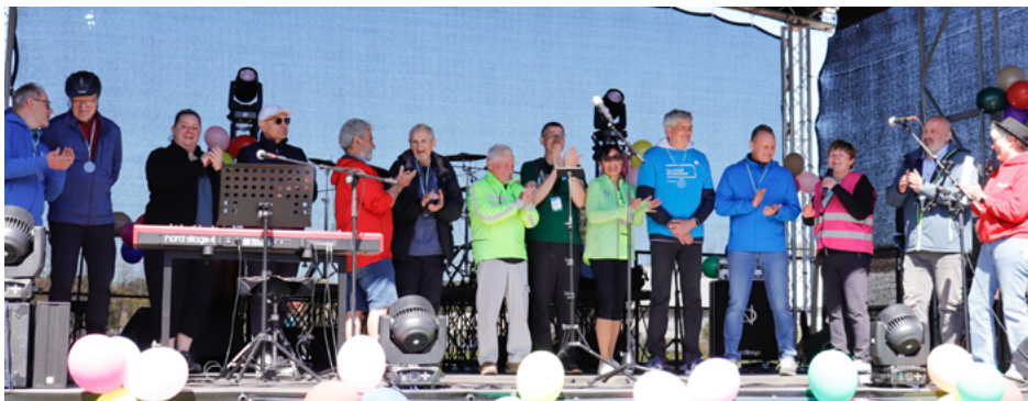
Begrüßung der Tourenleiter und Bürgermeister auf der Bühne im Sport- und Erholungspark.