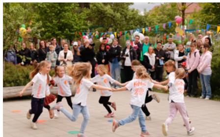
Aufführung der Tanzschule Kolibri

Für die Kinder und Familien wurde ein umfangreiches Programm organisiert. Neben einer Seifenblasenaktion gab es eine Disco, Schatzsuche, Kindertattoos, eine Bewegungsbaustelle sowie eine Fotobox. Auch kulinarisch wurde einiges geboten: Leckeres vom Grill, Kaffee und Tee, Waffeln, Popcorn und Zuckerwatte sorgten für gute Stimmung. Außerdem waren die Feu-