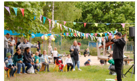
Liveprogramm mit Catu dem Traumfänger.

Für musikalische Unterhaltung und ein Kinderprogramm sorgte außerdem