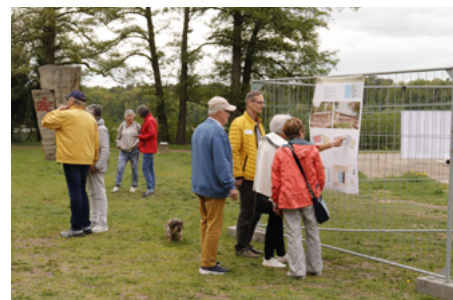
Besucher entdeckten vor Ort wie es im Kulturpark weitergeht.

Die Fertigstellung des Gesamtprojekts ist bis 2028 geplant. Der Nachbarschaftsgarten soll künftig ein Ort des Austauschs, der Begegnung und des bürgerschaftlichen Engagements werden. Wer sich an der Pflege der Pflanzen oder später an der Ernte beteiligen möchte, kann sich an Julia Jacob ( kultur@stadt-strausberg.de ) wenden.