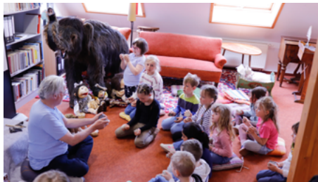
Musizieren mit Steinen - die Kinder der Kita Zwergengland haben Spaß.

Anschaulich und leicht verständlich erklärte Matysiak in seinem Mitmachprogramm komplexe Zusammenhänge: So wurde etwa ein 3.000 Meter hoher Eisberg mit der Höhe des Fernsehturms