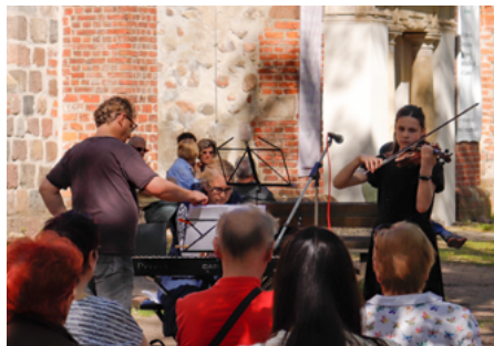
Neuer Programmpunkt: Das Capuccinokonzert in Zusammenarbeit mit der Musikschule Hugo Distler.

Auch das Frühlingsfest am Folgetag, dem 1. Mai, bot ein vielfältiges Programm aus Kunsthandwerk, Kulinarik und Unterhaltung. Insgesamt 70 Händler und 20 geöffnete Geschäfte luden zum Bummeln und Entdecken ein. Die Händler präsentierten unter anderem Holzprodukte, Keramik- und Gießtonarbeiten, Gewürze, Seifen sowie regionale Erzeugnisse und Emailleprodukte für die heimische Küche.