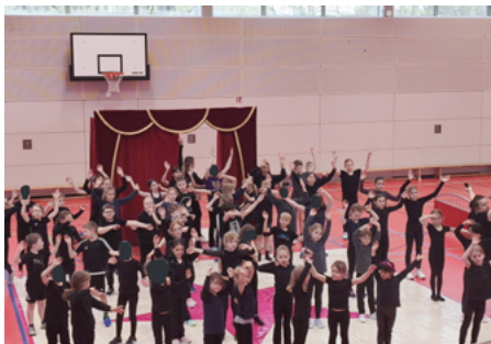
Auftritt der Kinder aus dem Hort „Strausseestrolche“.

Eine erlebnisreiche Ferienwoche liegt hinter den Kindern des Hortes „Strausseestrolche“. Gemeinsam mit dem Zirkus „Belli“ und Familie Spindler studierten die Kinder in den Osterferien vier Tage lang ein abwechslungsreiches Programm ein, das anschließend in der großen Turnhalle präsentiert wurde. Auf der Bühne zeigten die jungen