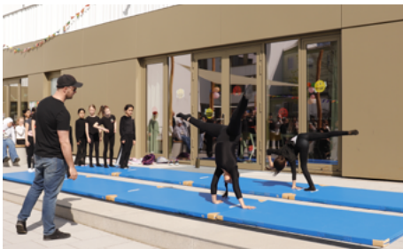
Turnvorführung: Der Hort bietet viele AGs, um die Kinder in ihren Interessen zu bestärken.

Jedes Jahr im April lädt der Hort am Annatal zum traditionellen Frühlingsfest ein. Auch in diesem Jahr erwartete die Besucher ein abwechslungsreiches Programm mit vielen Angeboten für Kinder, Eltern und Gäste.